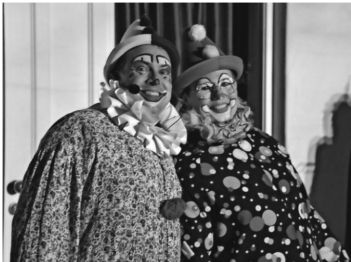
Die Fasnet und der Clon freuen sich auf die Fasnet 2024