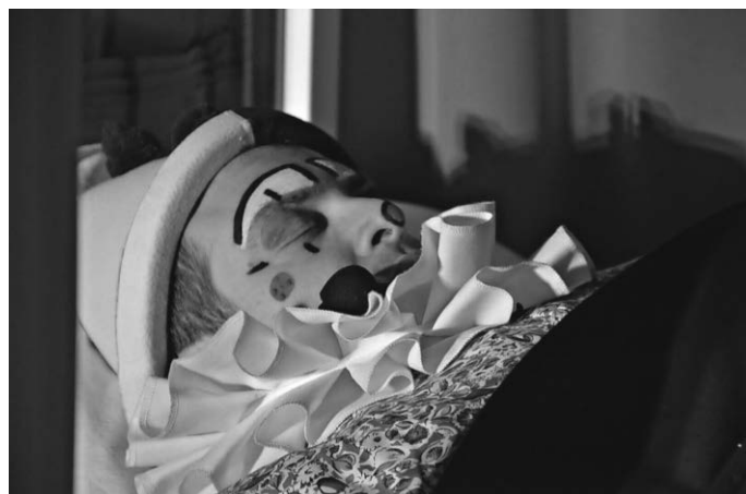
Die Fasnet bevor sie „sanft“ aufgeweckt wurde

Weitere Höhepunkte des Abends waren auch die Auftritte unserer Tanzgruppen den Sugar Girls, den Hupfdohlen und die Tanzgruppe unsere kleinsten den Henkerhauskids. Anschließend klang der Abend noch gemütlich im Neunerbeck aus. (SR).