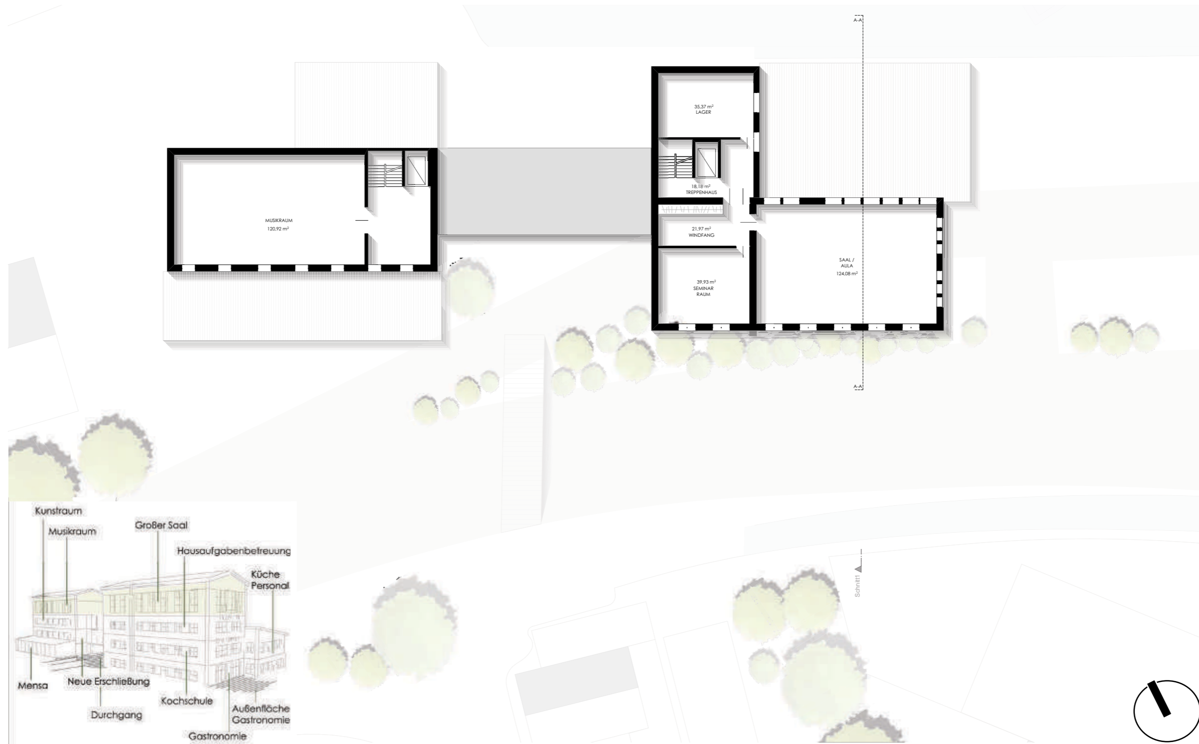
1.200 GRUNDRISS 3.OBERGESCHOSS