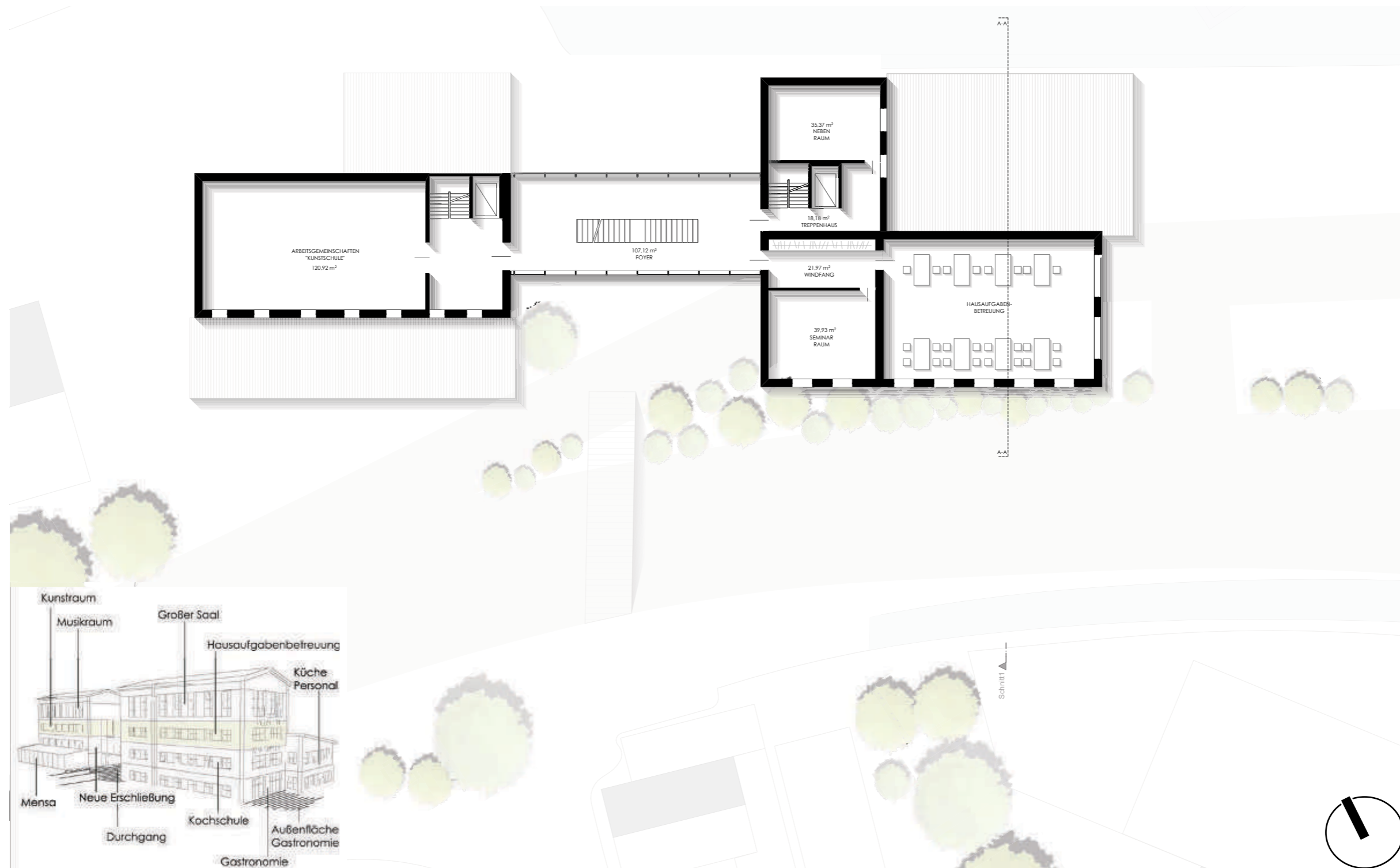
1.200 GRUNDRISS 2.OBERGESCHOSS