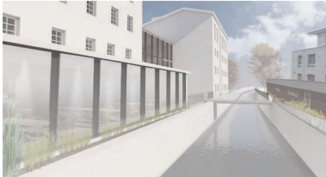
PERSPEKTIVE - Mensa