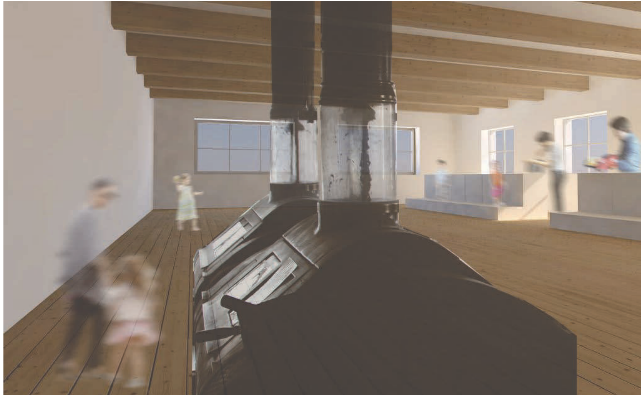
PERSPEKTIVE - Kochschule