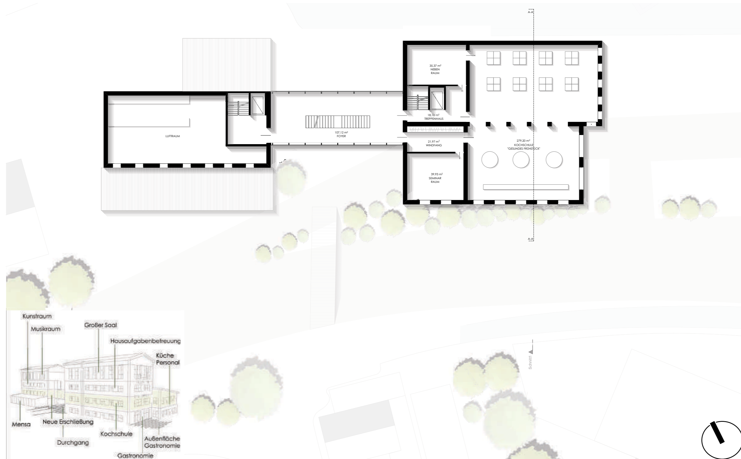
1.200 GRUNDRISS 1.OBERGESCHOSS