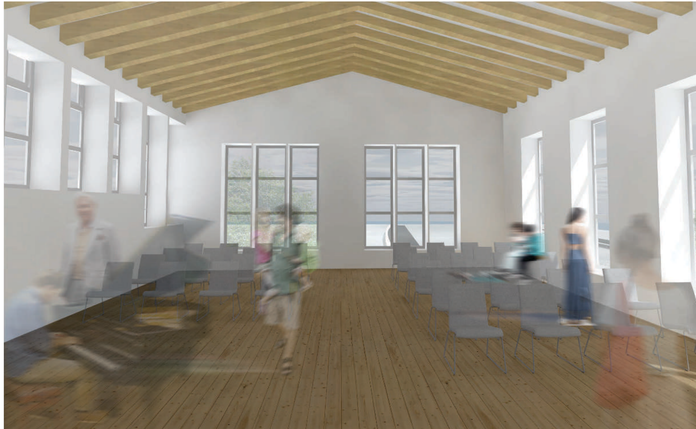
PERSPEKTIVE - Saal/Aula