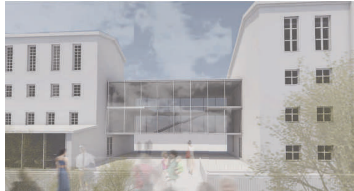
PERSPEKTIVE - Brücke/Eingang