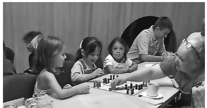
beim Mensch - ärgere - dich - nicht helfen die Betreuer...