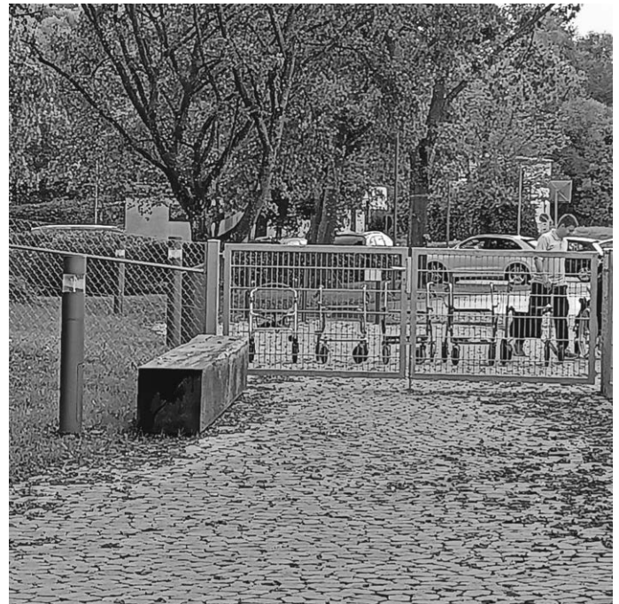
Rollatoren am Kindergarten?