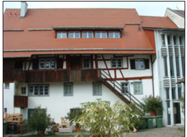
Rückansicht mit Eingangsbereich (rechts)