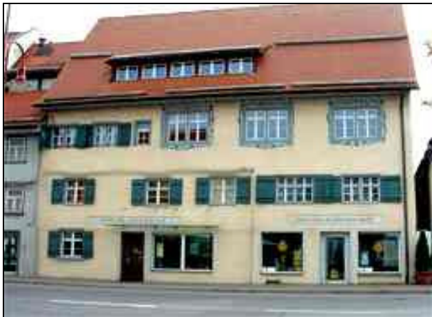
Vorderansicht von der Straße aus